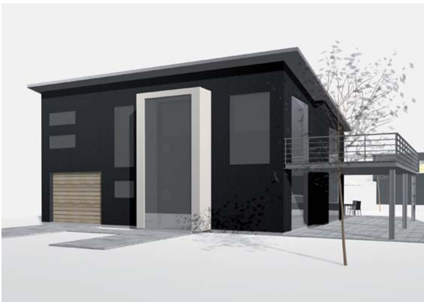
OPHOLD OG ALTAN (MØRKE FACADER)