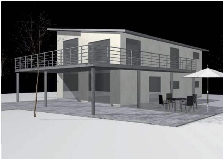
OPHOLD OG ALTAN (LYSE FACADER)